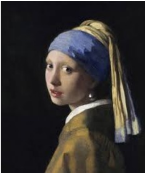
La jeune fille à la perle - 1665

b) Dans chaque texte de la série TD2020.4, retrouve les passages où se cache chaque tableau.