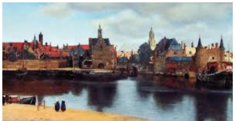
Vue de Delft - 1660-1661