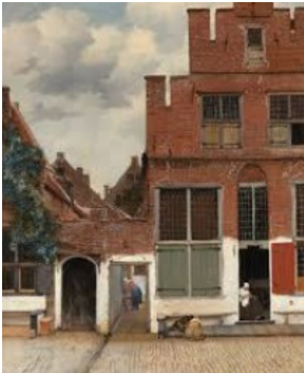
La ruelle - 1658