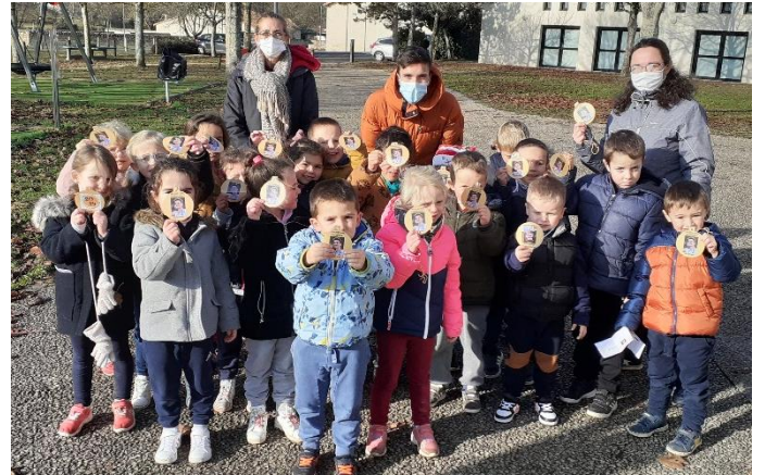
Classe de MS/GS