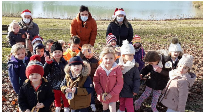
Classe de PS/MS