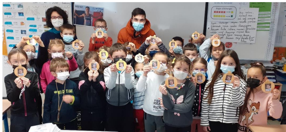
Classe de CP/CE1