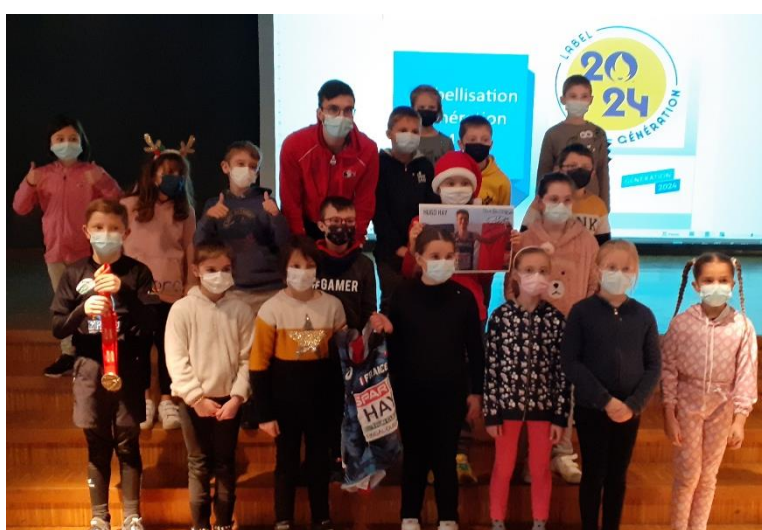
Classe de CE2/CM1