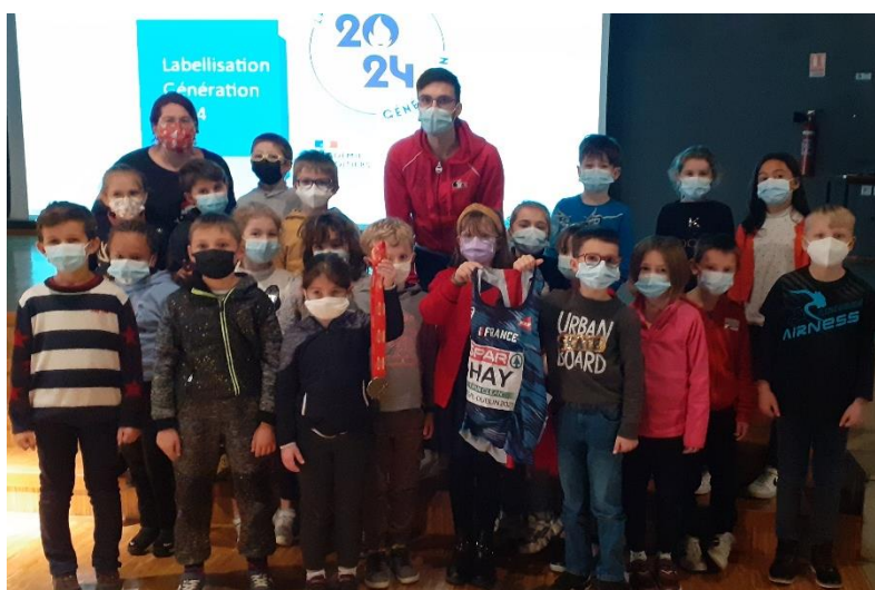
Classe de CE1/CE2