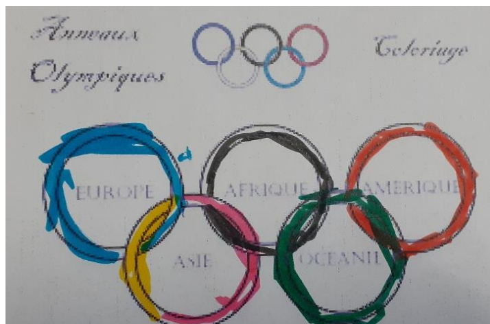
Enfant de Petite Section

De plus, ils ont découvert les anneaux olympiques (reproduction en graphisme / avec des cerceaux). Ils ont également regardé des photos et vidéos de sportifs en action et ont été sensibilisés au sport adapté (basket fauteuil, boccia, goalball).