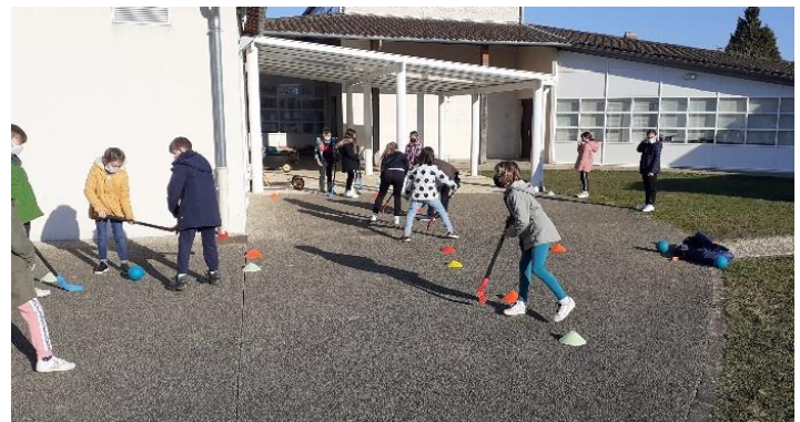
« Hockey sur goudron »