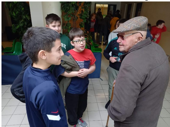
Echanges entre les enfants et un résident de l'EHPAD de Civaux

Enfin, le mardi 28 février, ce fut au tour des élèves de cycle 3 des écoles de Civaux, Mazerolles, Sillars et l'Isle Jourdain de se retrouver dans le gymnase. Un partenariat entre l'école et l'EHPAD de Civaux existe dans le cadre du label G2024. Aussi, des résidents sont venus admirer les enfants en action et échanger avec eux.