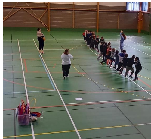
Tir à la corde