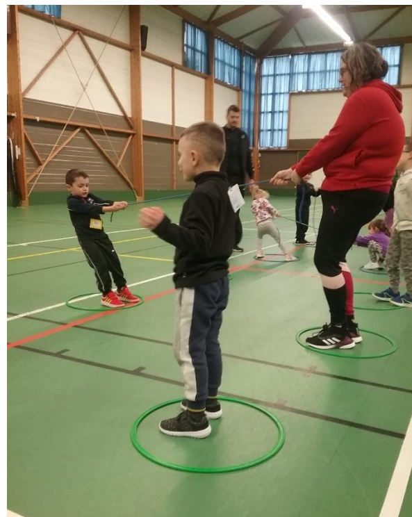
Atelier « tir à la corde »