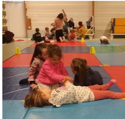
Atelier « jeux d'opposition »