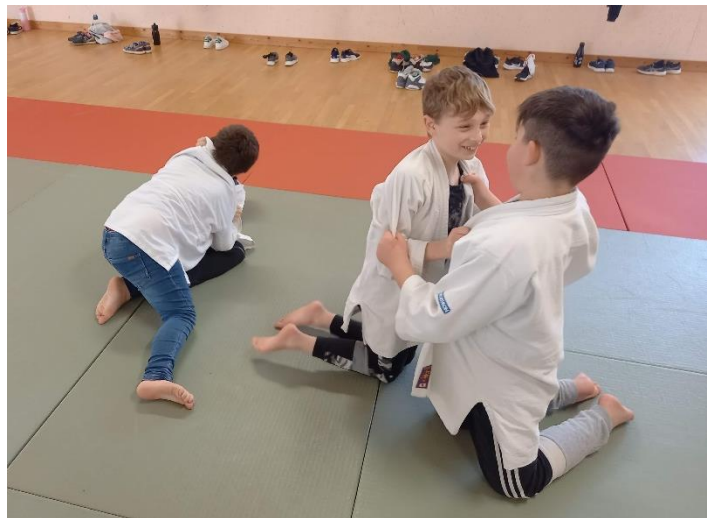
Atelier « judo »