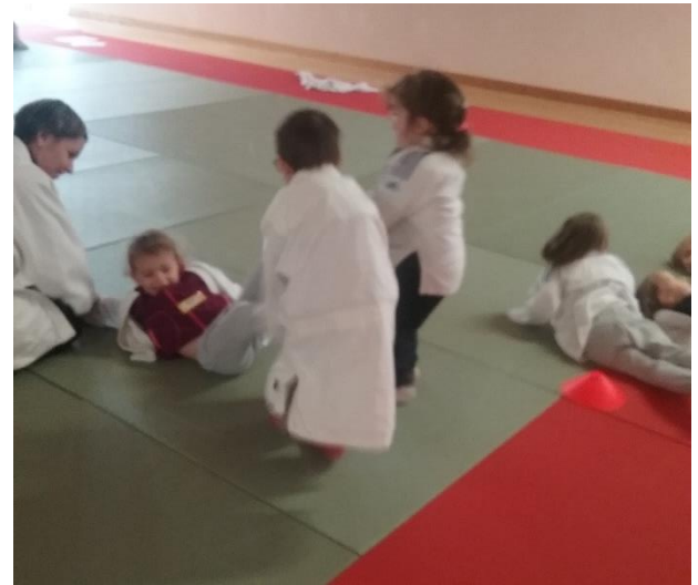
Atelier « judo »