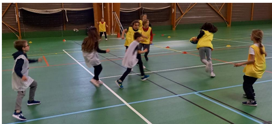
Atelier « rugby toucher 2 secondes »