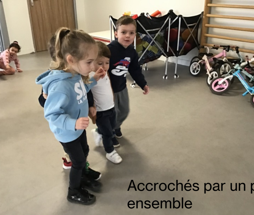
Accrochés par un pied, on marche ensemble