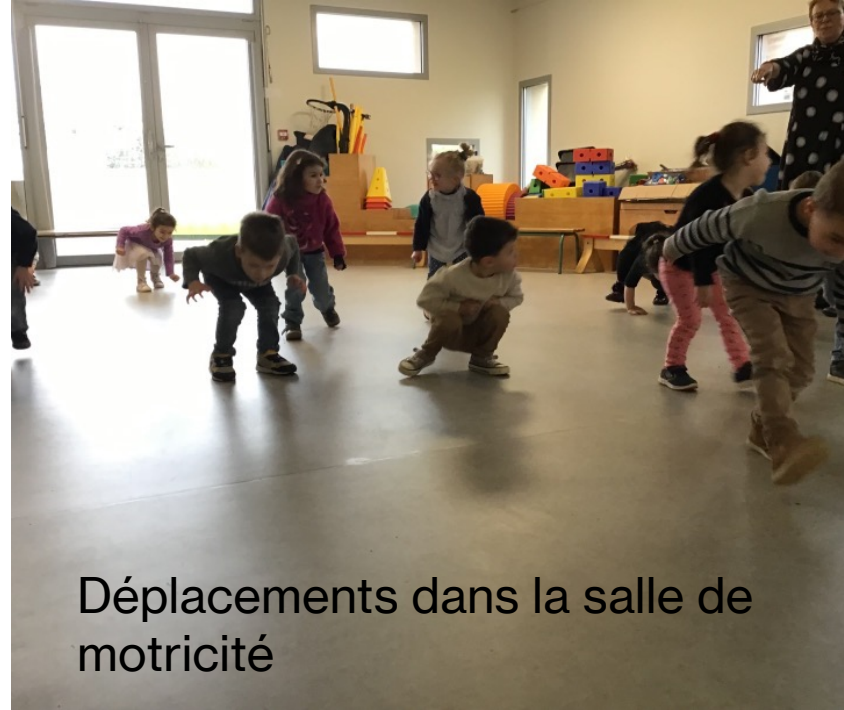
Déplacements dans la salle de motricité