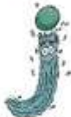
le jet d'eau