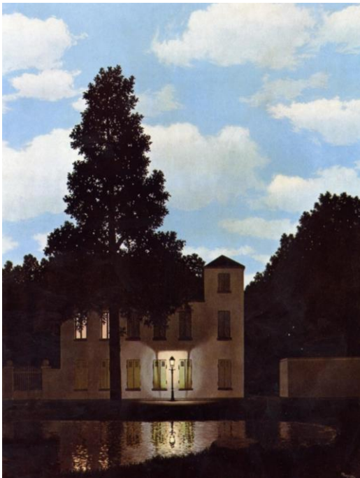
René Magritte, L'empire des Lumières, 1954