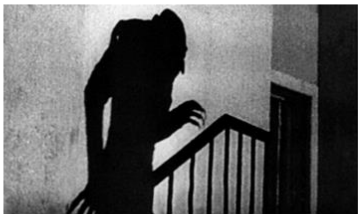
Murnau - Nosferatu le vampire, 1922