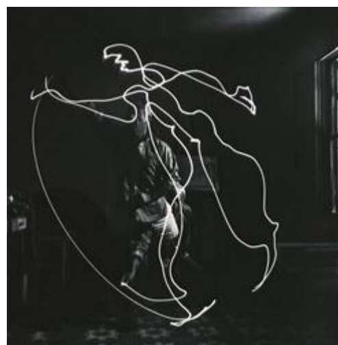
Picasso - light painting, 1949