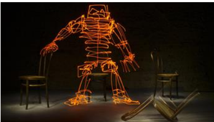
Jadikan - 189 secondes, 2012