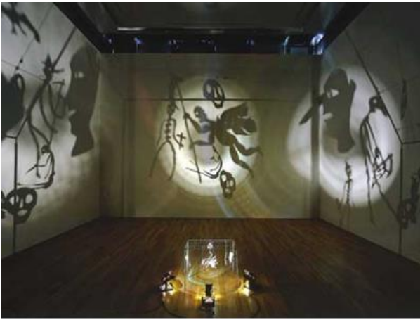
Boltanski – Théâtres d'ombres, 1984

Princes et princesses de Michel Ocelot : extraits sur le site Nanouk